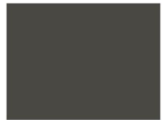
RAL 7022 Umbra Grey