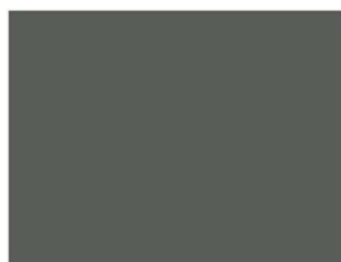
RAL 7010 Tarpaulin Grey